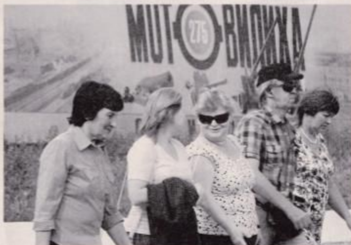
Каждому хочется гордиться предприятием, на котором он работает

Взаимная поддержка и взаимопомощь. Атмосфера взаимной поддержки и взаимопомощи между Работниками, оказание содействия молодым работникам и специалистам Компании и уважение ее ветеранов – естественные для работников Компании нормы корпоративного и внеслужебного поведения.